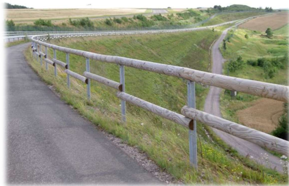
Clôture CADIZ – en campagne