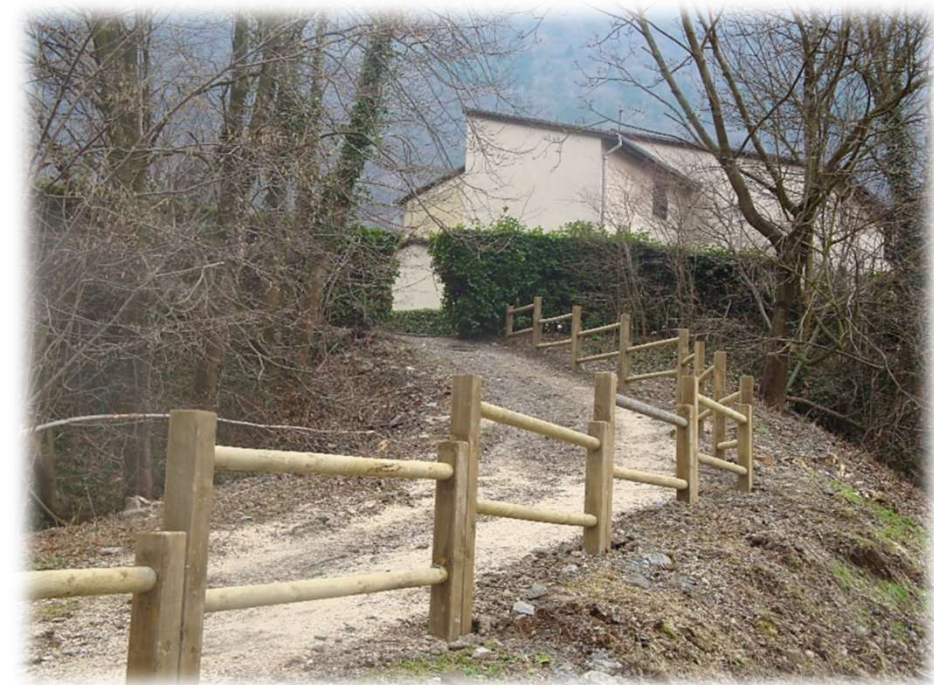
TREVI supports carrés en bois massif autoclavé