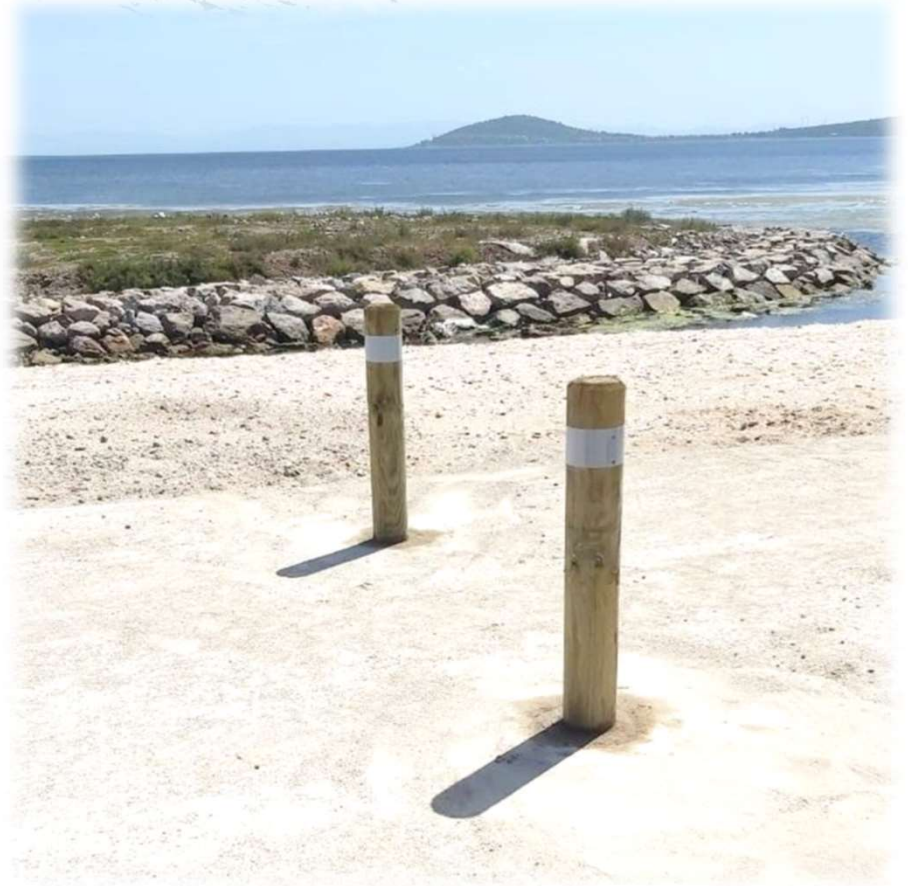
Bornes fixes 140mm - Littoral