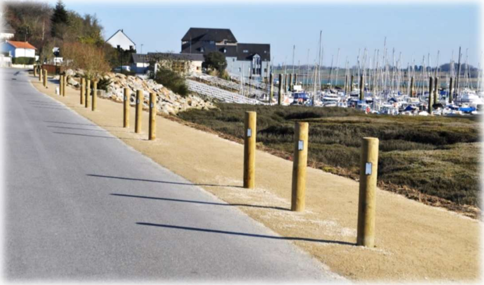
Bornes fixes 140mm avec réflecteur microbilles de verre vertical (optionnel)