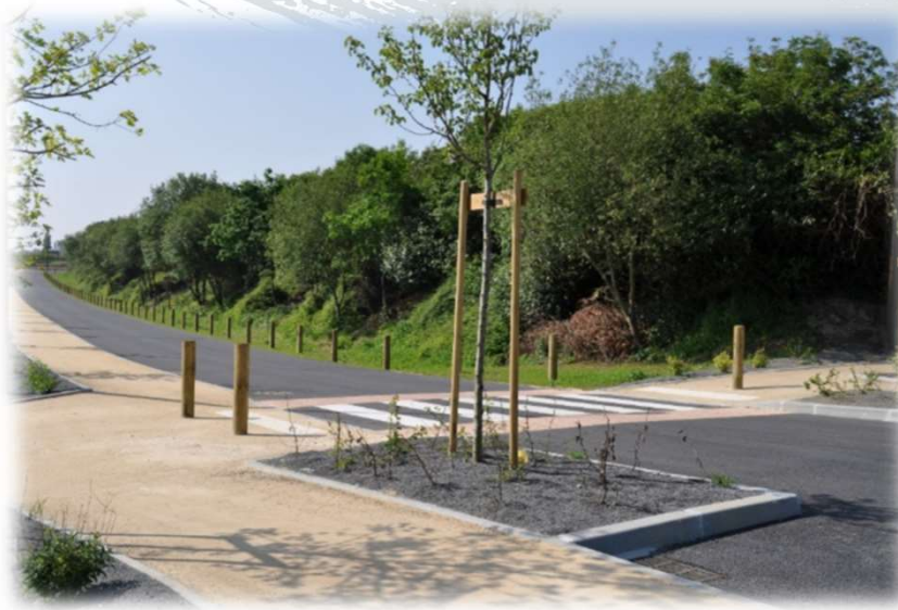
Bornes fixes à sceller dans le sol