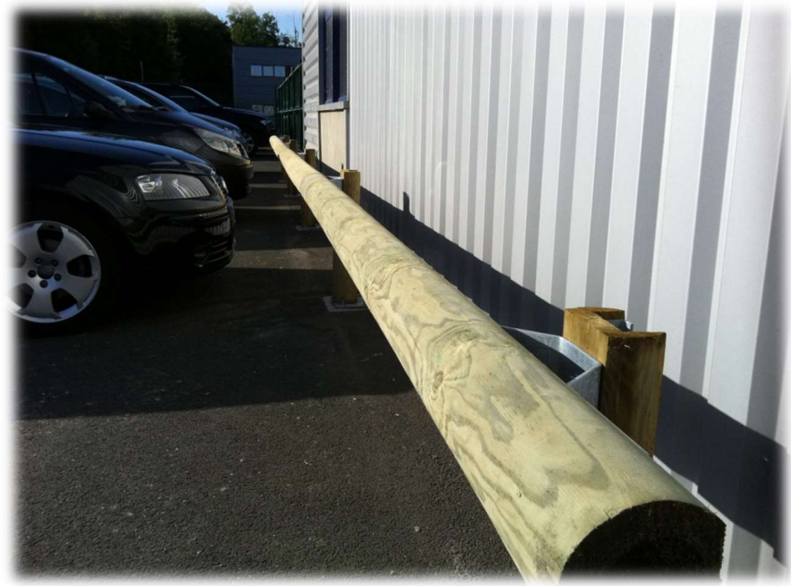
Barrières Amsterdam – Parking et pistes cyclables