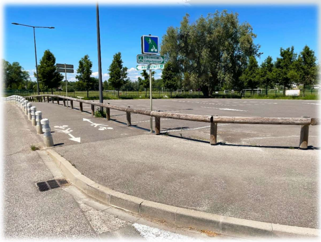
Barrières Amsterdam – Parking d'une commune